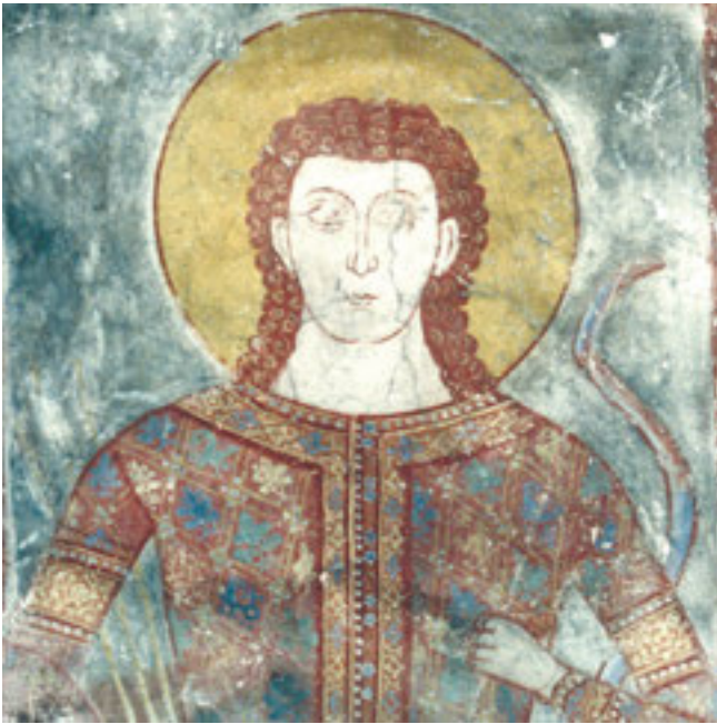
6. Младић Дејан, Велуће