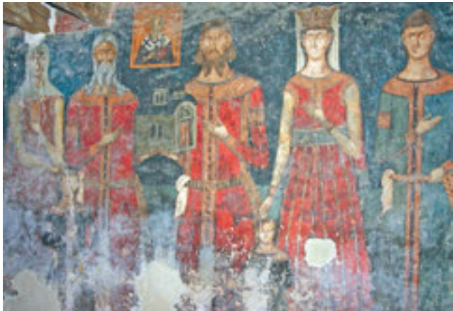
4. Ктиторска композиција, Псача 4. Ktitor's composition, St. Nicholas in Psača