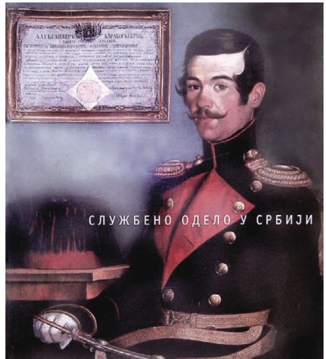
СЛУЖБЕНО ОДЕЛО У СРБИЈИ У 19. И 20. ВЕКУ , ИМС И ГАЛЕРИЈА САНУ, БЕОГРАД, 2001